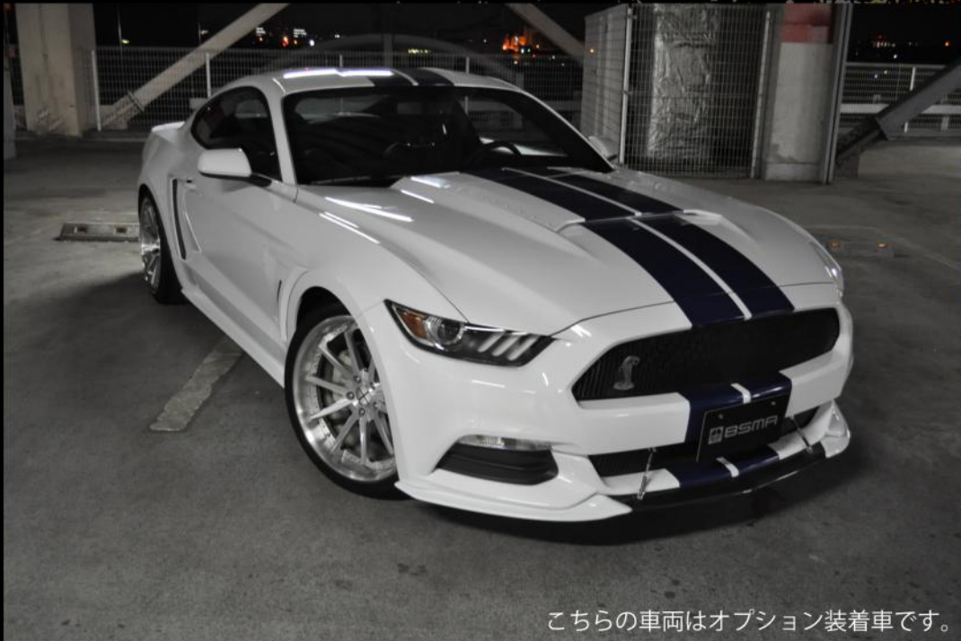
こちらの車両はオプション装着車です。